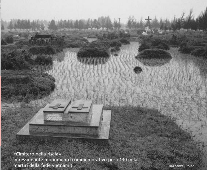
«Cimitero nella risaia» impressionante monumento commemorativo per i 130 mila martiri della fede vietnamiti.