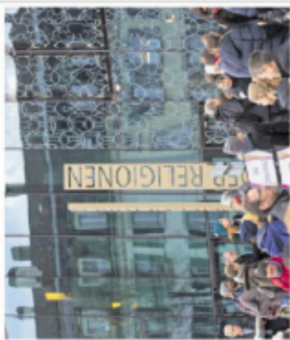
NEP RELIGIONEN - Manifestazione per i diritti della religione. Per favore

È in chiaro scuro il bilancio del rapporto 2016 di «Nicht in Chiesa» che soffre: Le nostre leggi garantiscono i diritti fondamentali, il problema è l'integrazione