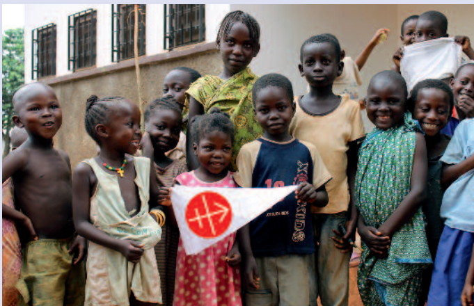
Il loro futuro è anche il nostro: un grazie dai bambini della Repubblica Centrafricana.

Il numero crescente di richieste di aiuto dall'Africa rispecchia la crescita della Chiesa in questo continente tanto che esse ammontano al 34% delle richieste pervenute. Particolare attenzione è stata data ai Paesi nella regione del Sahel, come anche alla Nigeria Settentrionale, al Kenya, alla Tanzania e al Madagascar, Paesi nei quali si sta diffondendo una forma aggressiva di islam. Nel Vicino Oriente, la culla della cristianità, gli aiuti di emergenza e per la sussistenza sono piuttosto cospicui e garantiscono la presenza dei cristiani nella regione. In Asia la Chiesa ha bisogno di sostegno non solo nei Paesi che hanno sofferto o soffrono ancora sotto il comunismo – Cina, Vietnam e Laos – ma in misura maggiore anche in quelli dove induismo o islam radicale portano sofferenza e persecuzione contro i cristiani, come in India e in Pakistan, oltre che in alcune zone delle Filippine. In Europa centrale e orientale l'aiuto si è spostato dai progetti per l'edilizia religiosa a quelli per la formazione di base e l'aggiornamento. Sono principalmente i Paesi balcanici, dove forme radicali di islam rendono difficile la vita ai cristiani che grazie alla nostra solidarietà rimangono saldi nella fede.